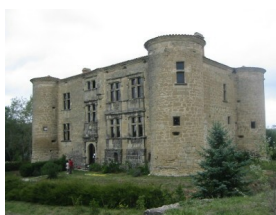
Château de Roquevidal

Découverte de la Route du Pastel et de ses châteaux