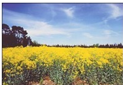
Champs de Pastel

Nous vous signalons que notre service de restauration n'assure pas de régime alimentaire spécifique.