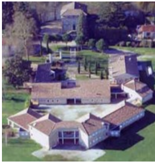
Domaine de Flamarens

Comment se rendre au Domaine de Flamarens