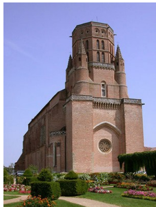
Cathédrale de Lavour

En plein cœur du Tarn, et à mi-chemin entre Toulouse et Albi, la ville de Lavour, cité cathare, est la capitale du Pays de Cocagne. La culture du pastel, créa un essor économique sans précédent qui fit la renommée de la région à la fin du Moyen Age et à la Renaissance. De nombreux monuments (églises, châteaux...) témoignent encore de cet âge d'or.