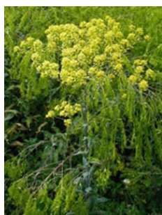
La fleur de pastel